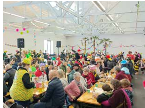
@ Kinderfasching 2026

Für die Kinderturnstunden (6 bis 10) sind wir wieder auf der Suche.