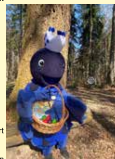
Perla in Osterlaune