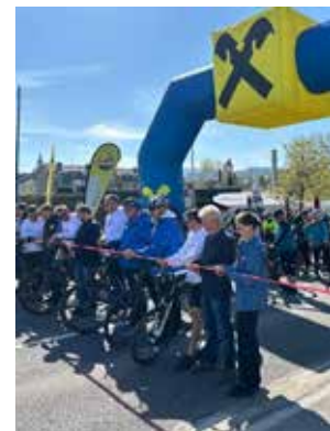
Autofreier Radtag